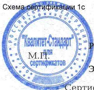
Схема сертификации 1с