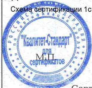
Схема сертификации 1с